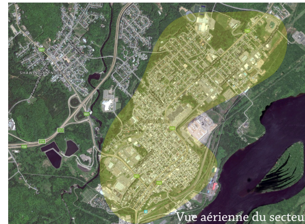
Vue aérienne du secteur

centrale, on trouve La Plaza de la Mauricie, qui offre une grande diversité de commerces et services de proximité. À l'est du secteur, divers services sont regroupés dans une bande commerciale. Ces secteurs sont plus facilement accessibles à pied, malgré la présence importante de stationnement.