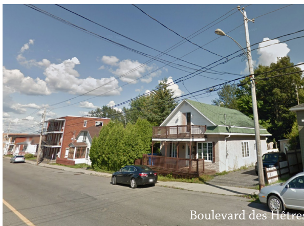
Boulevard des Hêtres